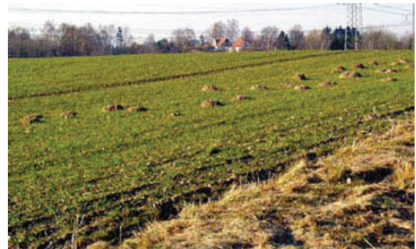
Typiske regelmæssige og hvælvede skud lavet af muldvarp

Muldvarpen kan forvolde skade ved sin gravende virksomhed. Er der mange muldskud, kan det forringe græsning og grønthøstning til ensilage, og jorden fra muldskud kan også forvolde skader på landbrugsmaskiner. Muldvarpen skader ikke planter ved at gnave i dem eller fortære dem, men af og til kan den presse planter op. Også i haver kan muldvarpen være generende.