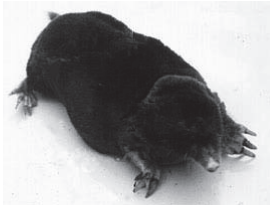
Voksen muldvarp. Størrelse ca. 15 cm.

På grund af sit sorte dæmoniske ydre og sin underjordiske levevis har den spillet en rolle for folketroen og -medicinen. Skulle man f.eks. se spøgelses ved højlys dag, var det muldvarpeblod, som skulle smøres over øjnene!