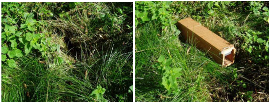
FFigur 2. Typisk mosegrisehul i vegetationen med dyrets stier med nedtrådt vegetation gående ud fra hullet.

En kasseformet mosegrisefælde af vandfast krydsfiner som vist på figur 2 er meget nem at bruge, da den blot skal anbringes over et af mosegrisens mange huller. Mosegrisen fanges levende og må derfor aflives bagefter.