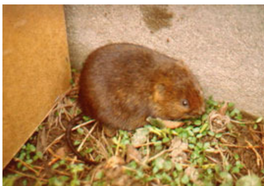
Figur 1. Mosegris. Størrelsen uden hale er 12-22 cm

Mosegrisen ( Arvicola terrestris ) kaldes af og til for vandrotte eller jordrotte, men er ikke en rotte. Den hører ligesom markmusen til studsmusene, der alle har en afstumpet snude, små ører, korte lemmer og kort hale. Hos den brune rotte er halen næsten lig med kroppens længde.